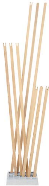
Esche unbehandelt ash untreated