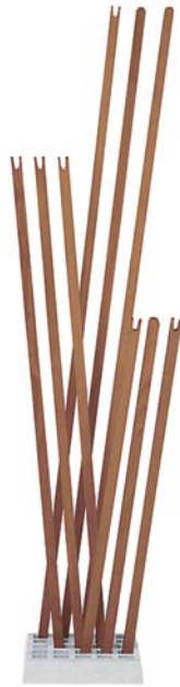
Nussbaum geölt walnut oiled